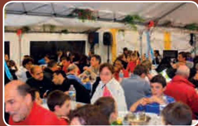
Randonnée nocturne, 22 juin 2013