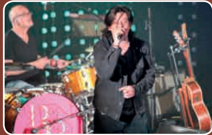
Benjamin Biolay, 7 juin 2013