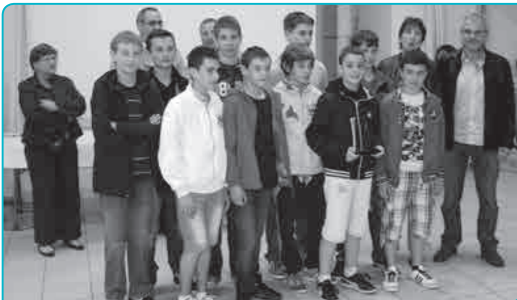
-14 garçons récompensés par la commission des sports de BOISSEUIL.