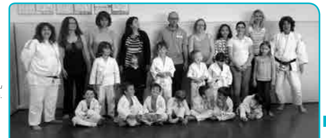
Les parents qui jouent le jeu sur le tatamis avec leurs enfants.