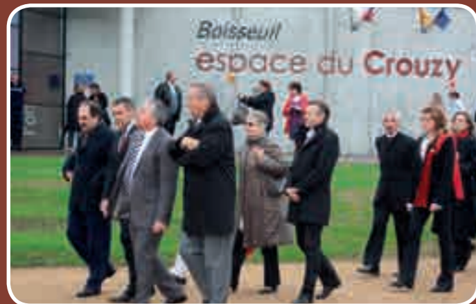
20 e anniversaire du jumelage ; 18, 19 et 20 mai 2013