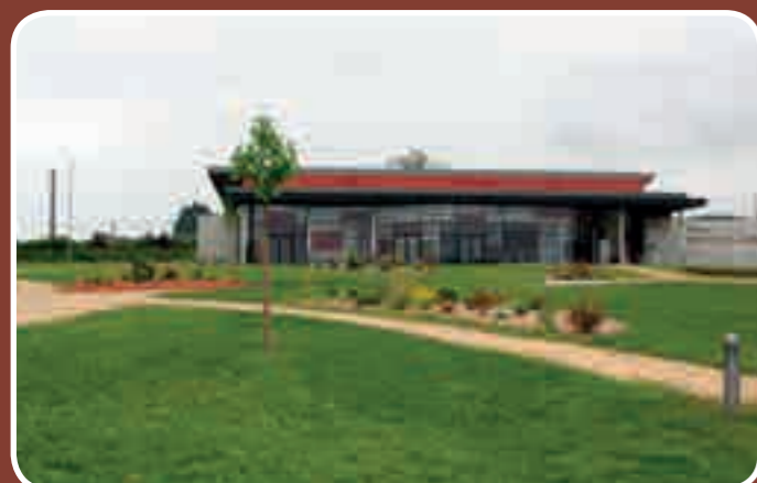
Espace du Couzuy, aménagement des espaces verts