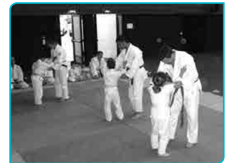
Quand les plus jeunes s'attaquent aux adultes.