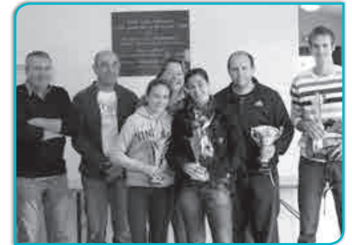
Les finalistes du Tournoi 2013